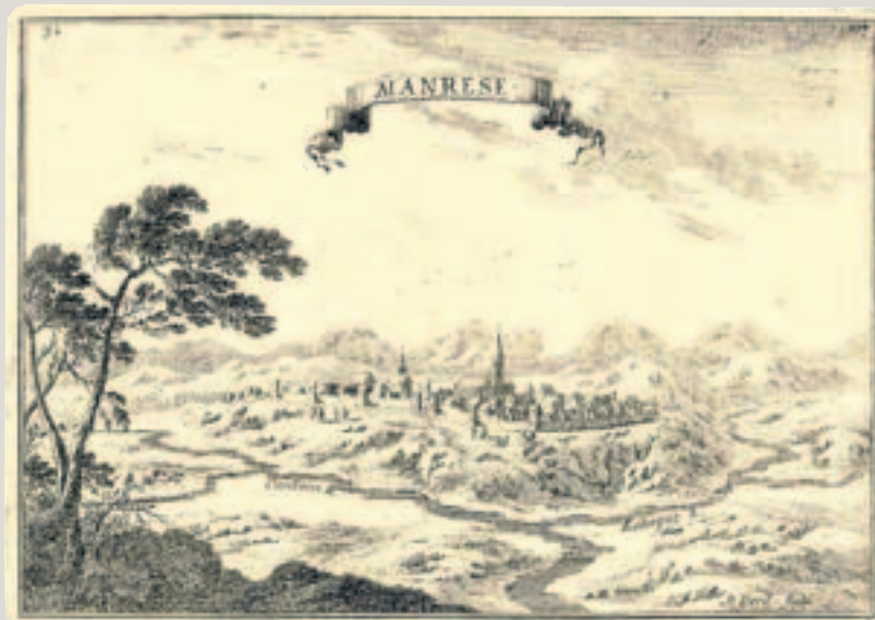
BIBLIOTECA DIGITAL HISPÁNICA