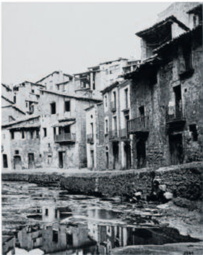
VIA DE SANT IGNASI DE MANRESA, ABANS DEL 1867. V&amp;A MUSEUM