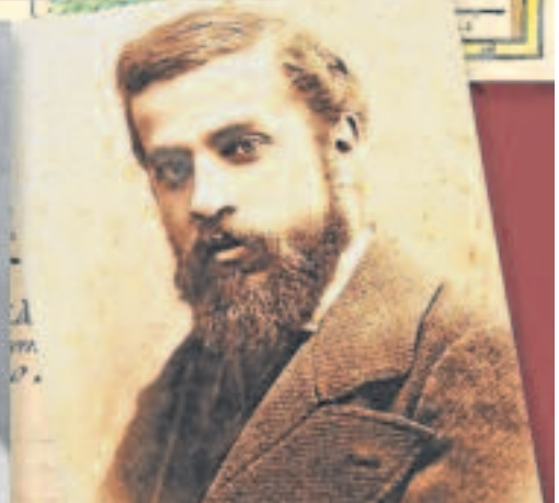
COLLAGE D'IMATGES EXTRETES DE LA WEB «VIATGERS A MANRESA»