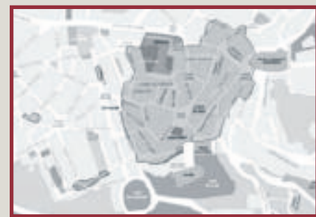
REVISTA DOVELLA 2011

«... i, abans d'anar-se'n, ficaren foc a unes 40 o 50 cases. I primer pillaren-les durant tres hores, amb què la meitat de la ciutat es cremà tota: a partir de Sant Miquel en amunt, tot el voltant de la Plaça, carrer de Santa Llúcia...»